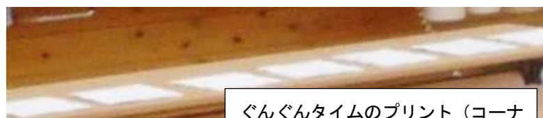
ぐんぐんタイムのプリント (コーナ)