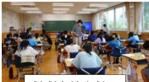
ぐんぐんタイム (5年)