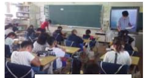
ぐんぐんタイム (4年)