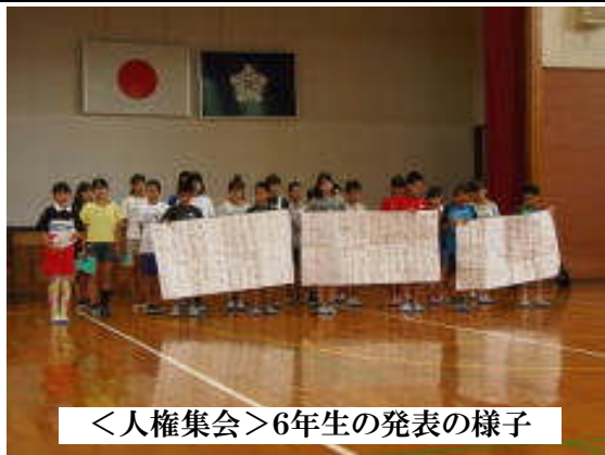
<人権集会>6年生の発表の様子