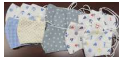
一枚一枚手作りの布マスクです。

学校を再開したとき、「どのように安全対策に取り組んでいくか」「授業や行事をどうしていくか」など、全職員で話し合って準備を進めています。龍野小職員一同、学校再開に向けて全力で取り組んでいます。