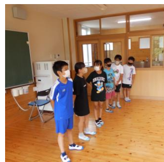
運営協議会の方々の授業参観と 感謝の気持ちを伝える6年生