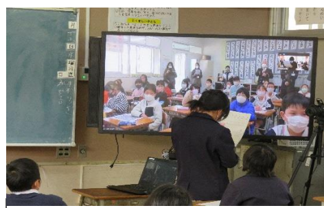
<学校の壁を超えた学習> 交流校や社会科見学先等の遠隔地との交流学習