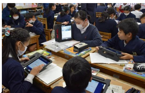
<協働での意見整理> 多様な意見・考えを議論して整理