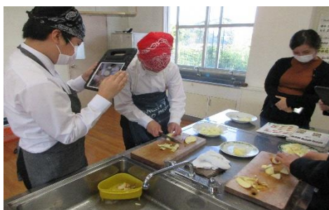
<調査活動> インターネットを用いた情報収集、写真や動画等による記録

文部科学省のGIGAスクール構想によるタブレットパソコンの子供1人1台環境は、これからの時代を生きていく子供たちが確かな学力を身に付けることができるように、そして、学校の臨時休業等緊急時においても子供たちの学びが十分に保障されるようにという考えから進められているものです。芦北町においても、令和3年度から本格導入できるように順次環境整備を進めてきました。これから1人1台端末を有効活用し、よりよい学習ができるよう取り組んでいきます。