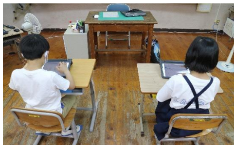
<子供の個に応じる学習> 一人一人の習熟の程度等に応じた学習