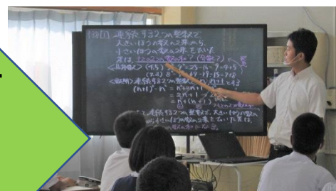
<教師による教材の提示> 画像の拡大提示や書き込み、音声、動画などの活用