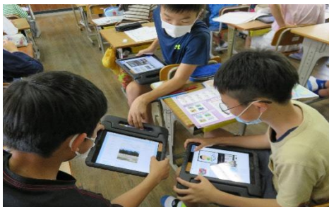
＜調査活動＞ インターネットを用いた情報収集、写真や動画等による記録