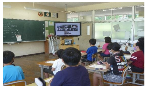
＜学校の壁を超えた学習＞ 交流校や社会科見学先等の遠隔地との交流学習