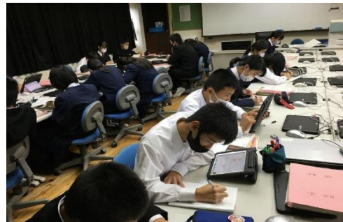
＜子供の個に応じる学習＞ 一人一人の習熟の程度等に応じた学習

※なお、通信費は各ご家庭で負担していただくことになります。契約に関しては、貸し出し希望者に直接ご説明いたします。