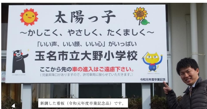
新調した看板（令和元年度卒業記念品）です。

特に、正門から入って正面に看板がありました。文字が消えて読めなくなっていましたので、新しくする必要がありました。予算がなくて困っていただけに助かりました。本当にありがとうございました。