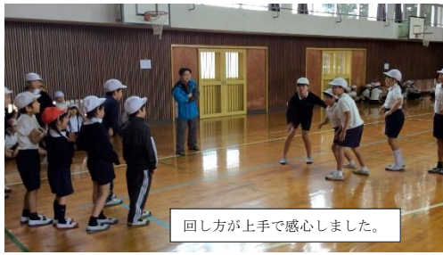
回し方が上手で感心しました。

児童の背中をそっと押してタイミングを教える姿もありました。そして、高学年の縄を回す技術も上手になりました。中には、縄を回しながら、次に跳ぶ児童の背中を押してやったり、縄に入るタイミングが遅れた時に縄を回すスピードを緩めて合わせたり、立ち位置を移動して跳