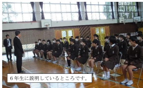
6年生に説明しているところです。