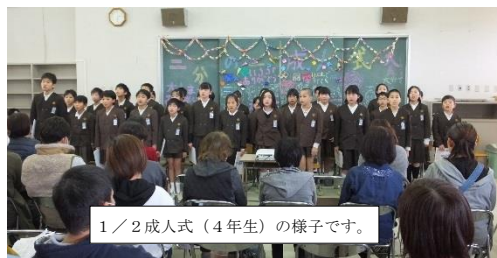
1/2成人式(4年生)の様子です。

かかわってこられたすべての方のおかげであり、その感謝の思いが伝わる会となりました。