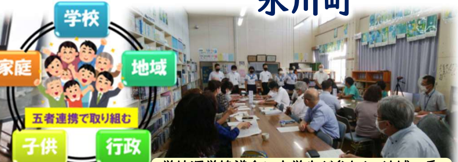
学校運営協議会に中学生が参加し、地域委員の方々と話し合いを行っている様子です。