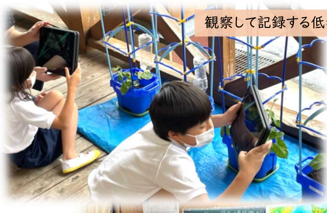
観察して記録する低学年

同校では、日常的に、子供たちも先生たちもICTを「普段使い」する姿がたくさん見られ、ICT活用を通じた、新たな学びが展開されています。