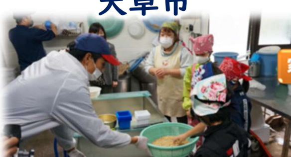
国語「すがたをかえる大豆」の学習後、地域の方の協力による豆腐作り体験の様子です。