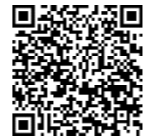
教育プラン全文 (QRコード又は コチラから )

子供たちが「熊本の心」「生きる力」「考える力」を兼ね備えることで、これからの変化の激しい社会の中で生き抜く精神や知識を身に付け、自らの夢の実現に向かって何度もチャレンジし、さらには子供たち一人一人の夢の実現が熊本の未来を創造する原動力となることを目指して、「夢を実現し、未来を創る熊本の人づくり」を基本理念として本県教育を推進します。