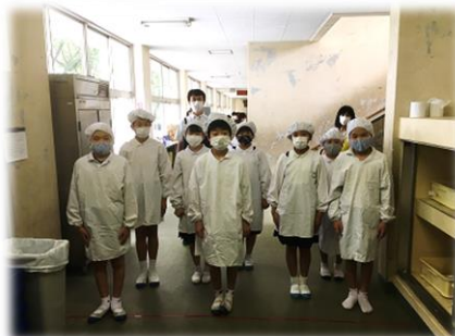
エプロン、マスク、帽子をつけて