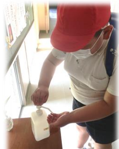
昇降口で手の消毒

このようなことを継続して取り組んでまいりますので、保護者の皆さまのご理解とご協力を何卒お願いいたします。