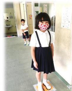
給食は間を開けて