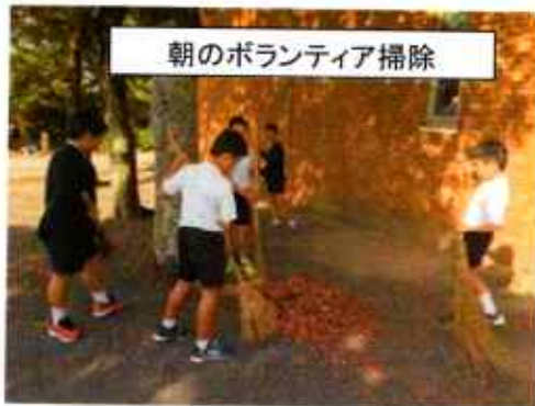
朝のボランティア掃除

4、5、6年生が決まった曜日の朝、校舎まわりをボランティア活動として掃除をしています。活動内容は、ゴミ拾いや落ち葉集め、花壇の草とりや水やりなどを行っています。児童の思いやりの心、愛校心は、学校の宝です。