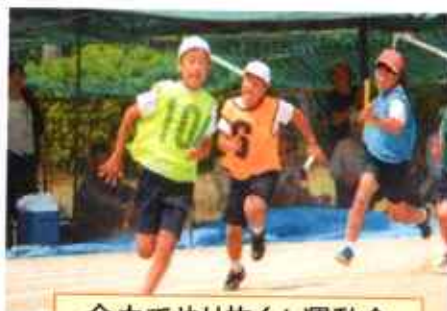
全力でやり抜く！運動会

運動会に向けて、全校で学校の美化作業に行いました。「心を合わせ、全力でやり抜く運動会！」の大会スローガンのもと、赤団・白団ともに心をつなぐ一致団結し、最後まであきらめず、一生懸命に取り組む素晴らしい運動会になりました。