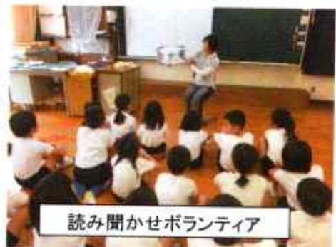
読み聞かせボランティア

毎週、木曜日の朝、保護者や地域の方々に来ていただき、教室で本の読み聞かせをしていただいています。子どもたちはとても楽しみにしており、ボランティアの方のお話に熱心に聞き入って有意義な時間となっています。本が大好きで、心豊かな子どもになって欲しいと願っています。地域の方々は、学校の宝です。