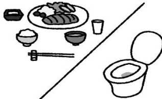
手洗いは食事の前、トイレの後は特に念入りに