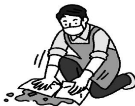
教室などで嘔吐があったら、すぐに先生に連絡→処理・消毒