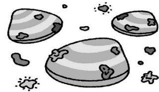
汚染された二枚貝などからも感染。十分加熱されたものを食べる