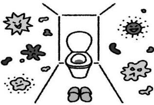
回復後も2週間程度、便などにウイルスが出る→しっかり手洗い