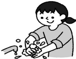
予防の基本は手洗い。ウイルスを体内に入れないことが大切

先月から、腹痛や吐き気などを訴え、保健室で休養したり、学校をお休みしたりする人が増えてきたように感じます。腹痛や吐き気などで注意したいのが、感染性胃腸炎です。特に今の時期は「ノロウイルス」の流行が心配されます。体調がすぐれないときは、無理をせず、早めに休養をとりましょ。