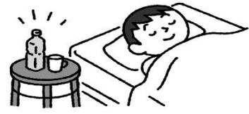
感染したら安静にして休む。下痢や嘔吐の後は水分補給を