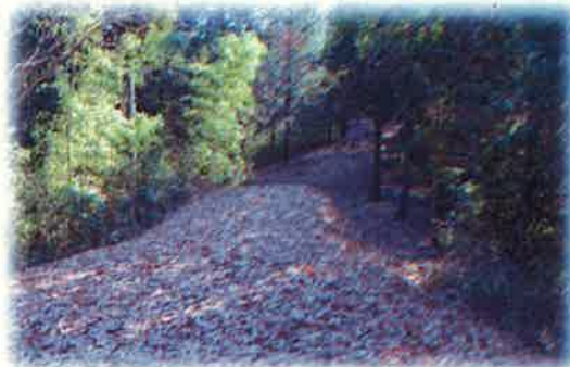
土塁の上を探検気分で歩こう!