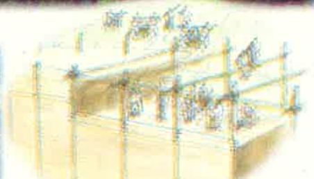
土塁をつくる様子(イメージ)