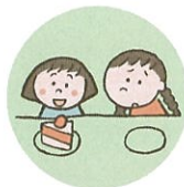
他のきょうだいは著しく差別的な扱いをすること