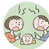
配偶者への暴力や暴言をこどもに見せること