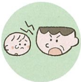
言葉で脅したり、脅迫すること

体罰は暴力でこどもの身体を傷つけるもので、心理的虐待は暴言などでこどもの心に深い傷を負わせるものです。こども本人への暴言でなくとも、配偶者や家族に対する強い言葉などもこどもの心を傷つけ、発達に影響する可能性があります。