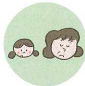
こどもを無視したり、拒否的な態度を示すこと