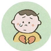
こどもの心や自尊心を傷つけるような言動をしたり、繰り返すこと