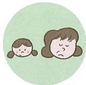
こどもを無視したり、拒否的な態度を示すこと