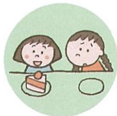
他のきょうだいとは著しく差別的な扱いをすること