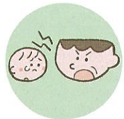
言葉で脅したり、脅迫すること

体罰は暴力でこどもの身体を傷つけるもので、心理的虐待は暴言などでこどもの心に深い傷を負わせるものです。こども本人への暴言でなくとも、配偶者や家族に対する強い言葉などもこどもの心を傷つけ、発達に影響する可能性があります。