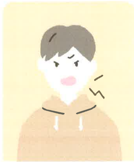
怒りやすくなった