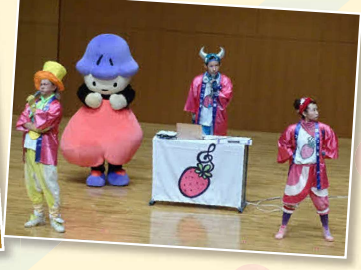
※画像は昨年度の熊本県人権フェスティバルの様子です