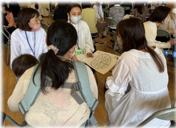
推進園における「親の学び」講座