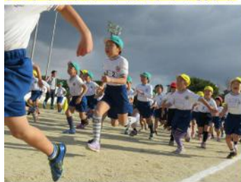
今こそ練習してきた力を出す時だ！