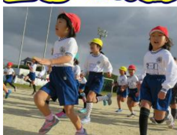
すっ、すっ、はっ、はっ、いい調子！