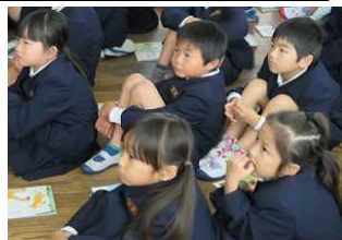
地震対応のビデオを真剣に見入る低学年の子どもたち