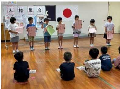
2年生 優しい言葉でいっぱいの水東小学校にします。