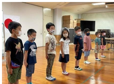
1年生 仲良くなるためにフワフワ言葉を使います。

6月23日の人権集会では、学習して感じたことや決めたことなどを発表し合いました。