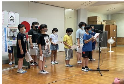
5, 6年生 人を見たり行動だけで判断するのはおかしいこと。 一人ひとりのことを知ること、相手の気持ちを理解することが大切です。