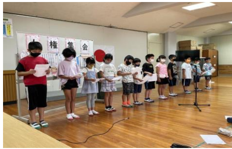
3, 4年生 寄り添うことを大切に、困っている人に声をかけたり、手伝ったりします。 仲良くなるために、たくさん話をしたり、遊んだりします。