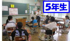
5年生 家庭科「ポケットティッシュカバーを作ろう」