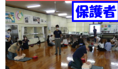
保護者 心肺蘇生法講習会「胸骨圧迫・AED」