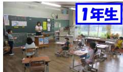
1年生 算数「もんだいをしきにかこう」

7月7日に授業参観・懇談会、心肺蘇生法講習会がありました。各学級で教科等の学習を参観していただきました。お家の方や地域の方に学習の成果を見てもらおうと張り切っている子供たちの姿が見られました。また、夏休みのプール開放に向けて、保護者向けの心肺蘇生法講習会を実施しました。たくさんの保護者の皆様に参加いただきありがとうございました。