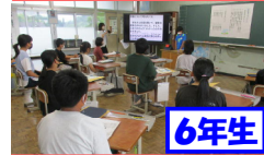
6年生 総合的な学習「修学旅行で学んだこと」