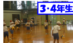
3・4年生 体育「ルールをたしかめながらゲームしよう」