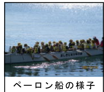
ペーロン船の様子

先週の修学旅行と同様、深田小学校の5年生と合同で実施しました。午前中にペーロン船に乗りました。一人二人が頑張っても船は動きません。みんなが力と気持ちを揃えてこそ船は動くということを身をもって体験してきました。天候にも恵まれ、ケガもなく実施できました。