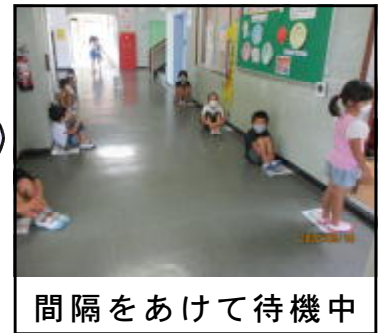
間隔をあけて待機中