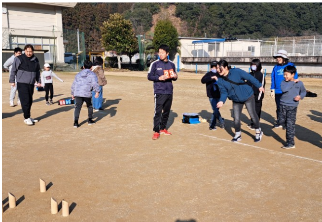
親子モルック大会

等には全家庭へ協力を呼びかけ、積極的に参加しています。運動会では、PTA競技に地域の方も参加いただき、会場を盛り上げました。夏には、親子美化作業と資源物回収にも取り組んでいます。秋には、保健体育部主催のモルック大会も開催し、親子での楽しい交流イベントとなっています。また、例年行っている12月の門松づくりは、PTAの有志で前日から材料を取りに行き、5・6年の保護者を中心に立派な門松を作ります。PTA会員数が減る中で、子どもたちの健やかな成長と未来のために、会員が一致団結し、尽力していきたいと思っています。