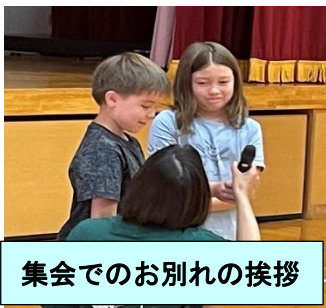
集会でのお別れの挨拶

6月26日~本日7月7日までの2週間、ノルウェー在住の姉弟が、本校に体験入学をしました。はじめは、慣れないことも多かったと思いますが、2年生、4年生の教室で、友達と仲良く活動したり、学習に一生懸命取り組んだりしていました。向上心、向学心、意欲の高い2人に感心する毎日でした。白旗っこのとっても、ノルウェーの文化等に触れるよい機会となりました。楽しい2週間を、ありがとう。また、会える日を楽しみにしています。