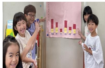
冊数が増え、喜ぶ1年生

1年間と学期ごとの読書冊数の目標を一人一人が決め読書したり、委員会が読書意欲を高める取組を行ったりしています。