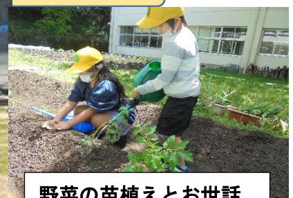
野菜の苗植えとお世話

5月の児童集会で、6年生が、各委員会の目標や取組について、全校児童に発表してくれました。自分たちでプレゼンを作成し、分かりやすい発表を行う姿が大変素晴らしく、頼もしく感じました。下級生も、6年生の姿をお手本に、ますます頑張ってくれると期待しています。