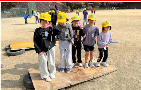
手作りロイター版で縄跳び