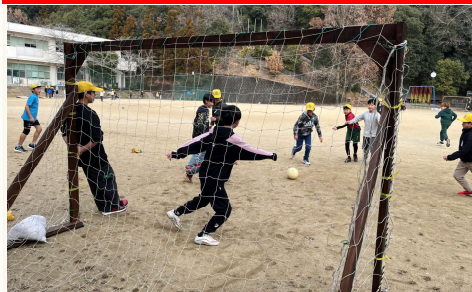
手作りサッカーゴールヘシュート！