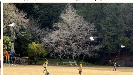
1年生 天まで上がれ！私の風