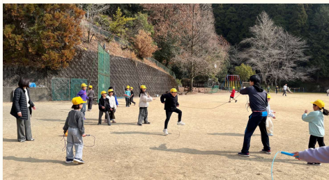
先生も一緒に、みんなでジャンプ！