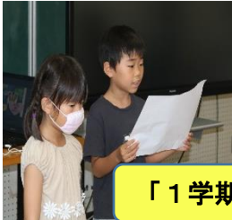
「1学期の振り返り」発表の様子

また、終業式の中では、1学期頑張ったことや、自分の目標に対する取組について、各学年の代表児童が発表をしました。また、本校独自の取組である「心の表彰」では、学年の代表の子供たちが、「ありがとう」の気持ちを込めた表彰を伝えたい相手に行いました。心が温かくなる時間でした。