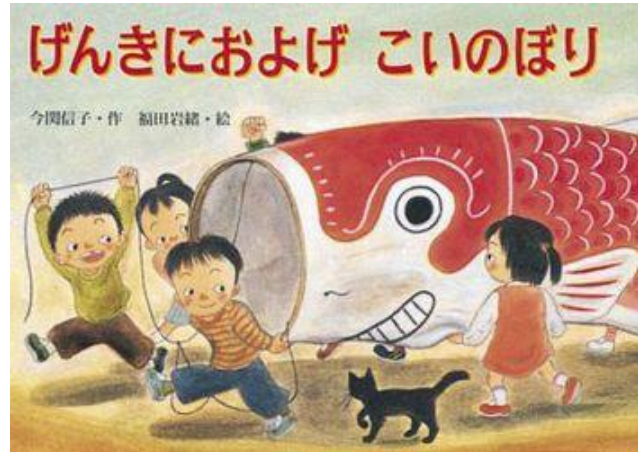
『げんきにおよげ こいのぼり』 こいのぼりのゆらい絵本。おさむらいさんの「のぼり」をヒントに、作られたそうです。