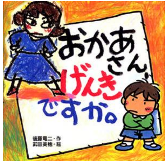
『おかあさん、げんきですか。』 小学4年生の“ぼく”が、お母さんに向けて書いた 手紙です。「おかあさんに、かんしゃのてがみをか きましよう」と、先生がはりきっているから、がんば ってかきます。…おもいきって、いいたいことをか きます。… みなさんなら、どんなお手紙をかきますか??