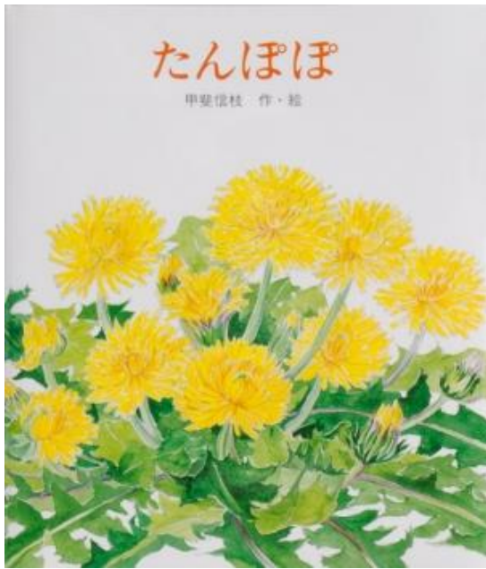
『たんぽぽ』 たんぽぽの一生をえがいた絵本。たくましさに 心をうたれる一冊です