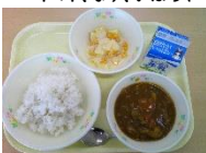
1月：冬野菜 れんこん、大根、ブロッコリー