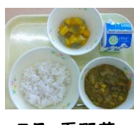
7月：夏野菜 トマト、なす、かぼちゃ