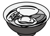
はまぐりのお吸い物

3月3日は「ひな祭り」。女の子の健やかな成長を願ってお祝いをする日本の伝統行事です。現在のように、ひな人形を飾るようになったのは江戸時代のことです。もとは人形を身代わりにして邪気をはらう「流しびな」が起源とされます。行事食として、ちらしずし、はまぐりのお吸い物、ひしもち、ひなあられなど、華やかな食べ物が並びます。