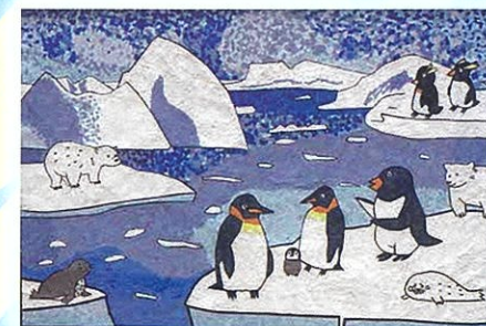
「流水の動物たち ～ゆかいな仲間～」 ニャンコグループ (城ヶ崎病院デイケア)