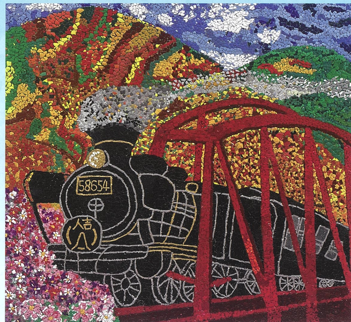
人吉SL号 菊池病院デイケア創作グループ