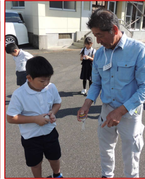
一番難しかったコマ回し!