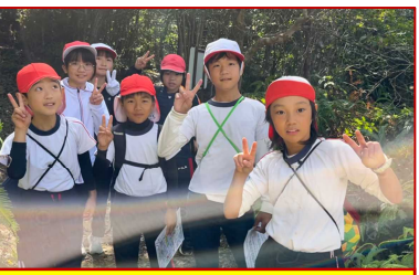
スコアオリエンテーリング!