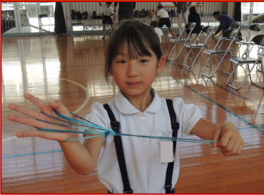
あやとりでホウキを作れました～!