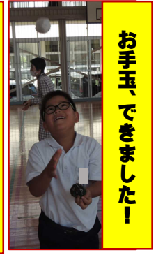
お手玉、できました!