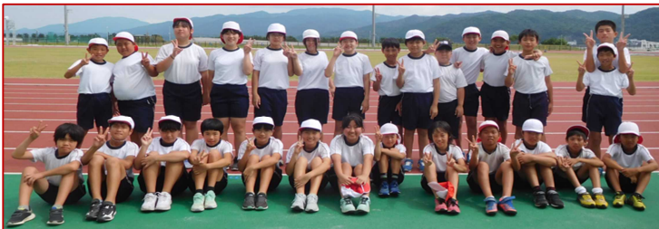
残暑の中、精一杯がんばった二十八人の5・6年生!