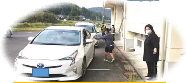
体育館に待機中の児童をプール側の体育館入り口で引き渡す