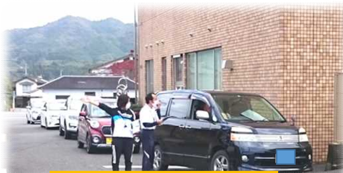
支所付近で、保護者名を確認