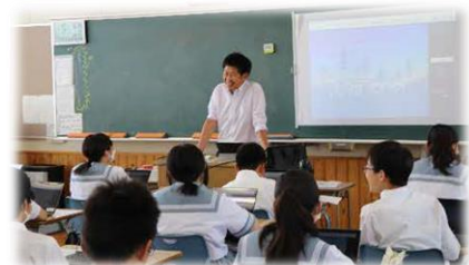
もっと知りたいに答えてくれる授業！