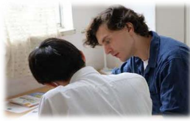
ALTの先生による個別指導も充実！