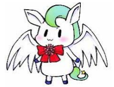
本校キャラクター わかごまる