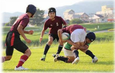
勉強も部活動も全力投球！

世界に羽ばたくリーダーの育成を目指し、心を育て、全国難関大学等への進学を実現する。 夢実現・未来への挑戦～Challenge your self-will～