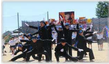
全校生徒で一丸となった体育祭演舞！