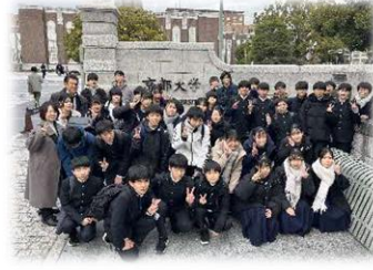
京都大学訪問と模擬授業で知的好奇心を刺激！