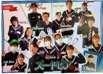
校内グローバルディ発表会・英語劇に挑戦！