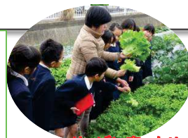
りっぱに育ったリーフレタスです！(3年生の収穫)

立派に育った野菜を地域の方に食べていただこうと、無人ボックスに時々入れてありますので、見てみてください。