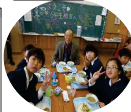
おいしく、楽しく給食を！