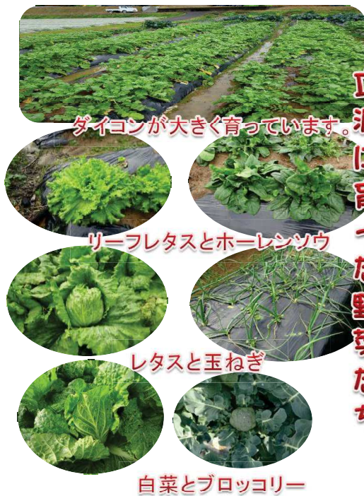
ダイコンが大きく育っています。