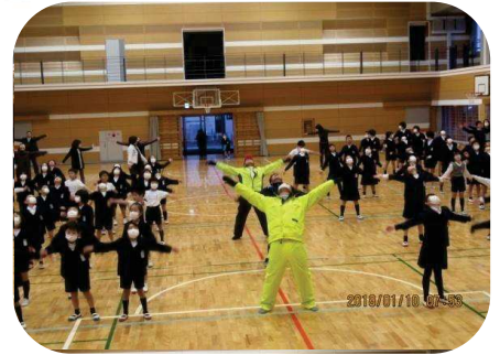
気持ちいい体操が出来ました。

1月10日(水)から始めました健康づくりラジオ体操は、雨のため体育館で実施となりました。子どもたちと地域の4名の方に参加して頂き元気よく体操が出来ました。朝から体を動かすことにより、すがすがしい気持ちになり今日も1日頑張ろうという気持ちになりました。まだ始めたばかりであることと、雨の影響であるとは思いますが、地域の方の参加が少なかったようです。これからは、徐々に参加者も増えてくれればと思っています。地域の方の積極的な参加をお願いします。そして子どもたちに声をかけていただきたいと思います。(毎週水曜日:7時50分から運動場で、雨の日は体育館で)