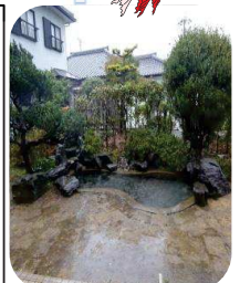
きれいになった池

学校の玄関横に池があります。ちょっとした癒しの場所ですが、池には小さい金魚系の魚がたくさんいました。その魚が鳥に食べられてしまいました。どなたか譲っていただける方はいないでしょうか？良かったら連絡ください。(35-0014)