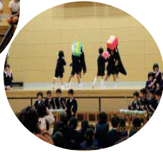
1年生の大きなクジラ雲