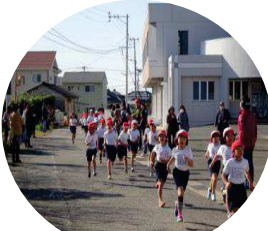
お母さんお父さんの応援を受け..

学校の行事について ○1月9日始業式 ○1月12日学校開放デー ○1月22日招待給食