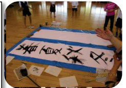
ほうきで・・・まとまる

11月10日今年最後のクラブ活動が行われました。最後のクラブ活動で、来年入る3年生がクラブ活動の見学に来ていました。楽しかったクラブ活動も5回行われ無事終了することが出来ました。この間活動の指導をしていただいたボランティアの先生方のお陰と深く感謝申し上げます。子どもたちも最後ということで、楽しく取り組み達成感を感じていたようです。また、クラブ活動に貴重なご意見をいただいています。来年からのクラブ活動に生かしていければと思います。大変ありがとうございました。