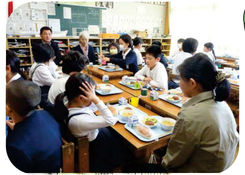
いただきます。楽しく食べました。