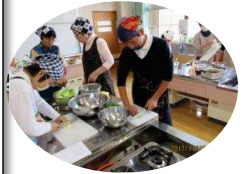
包丁も上達しました。