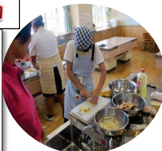
包丁使いが上手になりました。

9月12日第3回目のクラブ活動が行われました。それぞれのクラブで充実した楽しい活動ができました。子どもたちが楽しく出来るのもボランティアの方のおかげと感謝しています。活動内容は右記の通りです。