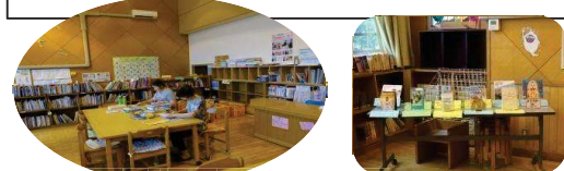
破れている本の修理をさせていただきました お勤めの本

今年も9月に台風が上陸し、日本列島を縦断して大変な被害が発生しています。台風はちょうど連休の時期に当たり、また、鹿児島の方に上陸したので天草にはあまり被害がなかったようです。2学期も始まり子どもたちも元気に登校出ています。学校行事も多くあり、学校支援ボランティアの方々には何かとお世話になると思いますが2学期もよろしくお願いいたします。