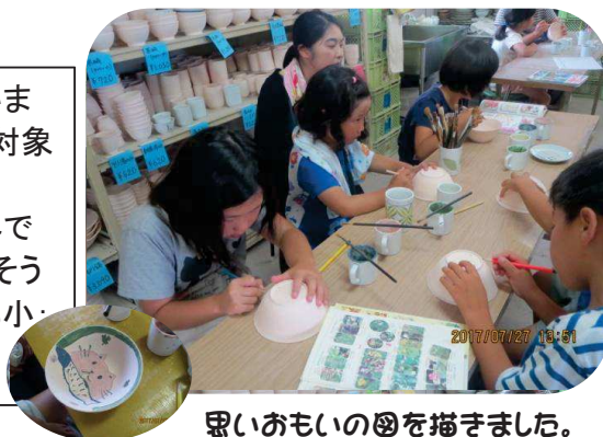
思いおもいの図を描きました。

子どもたちは、それぞれの思いで楽しく絵を描いていました。世界で一つだけの出来上がった作品は、各学校に2学期から入れてあるそうです。(各学校の参加者:坂小:4人、志岐小:15人、富小:2人、都小:4人)