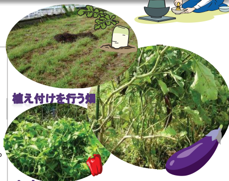
植え付けを行う畑

9月27日ボカシ作りを行います。1週間後野菜くずと混ぜて畑の下地を行います。まだ元気に育っている野菜たち！