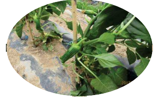
元気野菜が元気に育っています。