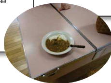
夏野菜カレーは大変おいしくいただきました。