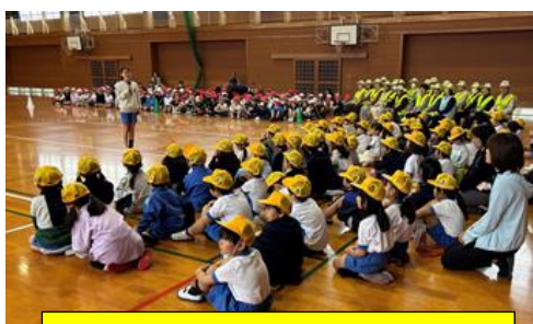
全校児童と「いっさつ見守り隊」の皆さんに見守られ、1年生の歓迎会がスタートしました。