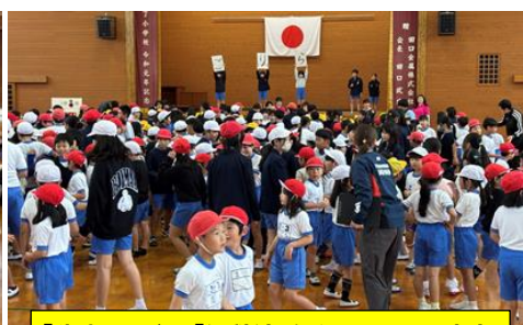
「先生クイズ」や「猛獣狩りに行こうよ」は、大変な盛り上がり。大いに親睦が深まりました。