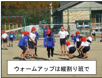
ウォームアップは縦割り班で

さて、今回の記録についてですが、新記録がかなり多く出ました!詳しくは、学級だより等でも触れられると思いますが、男子9人、女子3人の計12人が新記録を出しました。これだけ見ても、充実した大会だったことが分かります。また、友だちを応援する子供たちの声が、素敵でした。日常生活の中でも、お互いに声援を送り合える仲間として、これからもどんどん成長していくことでしょう。保護者の皆様の見守りも大変お世話になりました。