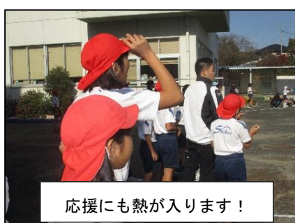
応援にも熱が入ります!