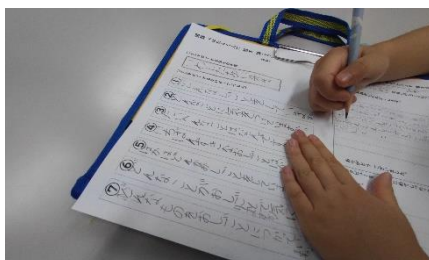
インタビューの質問がたくさん！

4月8日（火）に本年度がスタートし、早1か月。子供たちは元気で過ごしています。新しい担任の先生にも慣れ、伸び伸びと学習に遊びに頑張っていますが、疲れも溜まってくる頃。そんな中、授業の様子を覗いてみました。2年生は、国語で、相手に仕事についてインタビューする学習をしています。学校の先生に質問インタビューするのですが、通り一遍ではなく、「仕事について詳しく知るため」の、いい質問をたくさん考えていました。私も質問を受けましたが、「一番好きな仕事は何ですか」「どういうことに気をつけていますか」など、6項目の質問がありました。けっこう大人も考え込んでしまいそうな質問でこちらも勉強になりました。4年生は算数で折れ線グラフに関して気付いたことを出し合う場面で、先生から「ペアトーク必要ですか？」と問われました。何と答えるかなと思って見ていると、「必要です」「どうして？」「相手の考えを知りたいです」とのやり取りが……。嬉しい一場面でした。