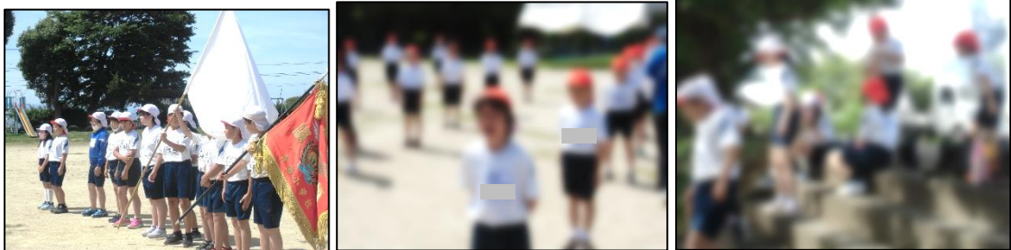
写真左から： 解団式の位置確認、歌での応援合戦、給水タイム

全体での練習は時間が限られていますので、集中して取り組む必要がありますが、子供たちはよく頑張っています。17日（金）の練習では、開・閉会式の動きがほぼ完成。式で役割がある子供たちはきびきびと動き、歌による応援合戦も本番さながらです（まだ声は出そうですが・・・）。待っているときの姿勢がいい子供たちが多いですね。時間を上手に使えるのも集中力があるからです。本番まであともう少し。体調に気を付けながらみんなでがんばります！