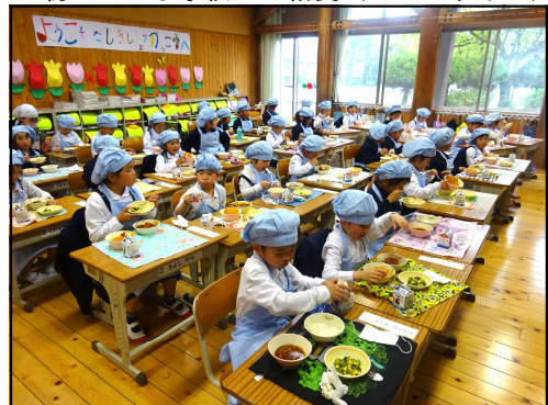
初めての小学校での給食（カレーライス）