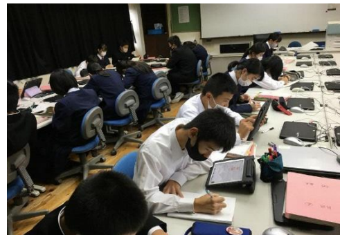
＜子供の個に応じる学習＞ 一人一人の習熟の程度等に応じた学習

※なお、通信費は各ご家庭で負担していただくこととなります。契約に関しては、貸し出し希望者に直接ご説明いたします。