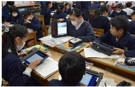
＜協働での意見整理＞ 多様な意見・考えを議論して整理