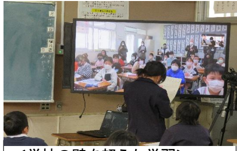
＜学校の壁を超えた学習＞ 交流校や社会科見学先等の遠隔地との交流学习

※ICTとは、通信技術を使って人とインターネット、人と人がつながる技術のことです。