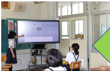
＜発表や話し合い＞ グループや学級全体での発表・話し合い