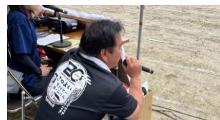
明治さんの気合の入った掛け声で踊りが引き締まりました