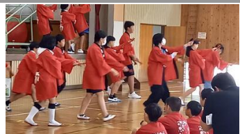
運動会で演技する「よさこいソーラン」を披露