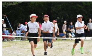
ゴールテープ前の大接戦