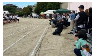
思いやりゾーンでは保護者の方のマナー遵守に感謝