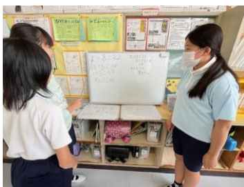
他のグループの人に自分たちの考えを説明する（6年生算数）