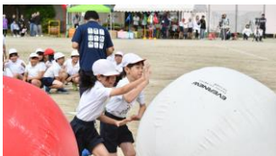
自分たちよりも大きな玉を上手に転がして運びました