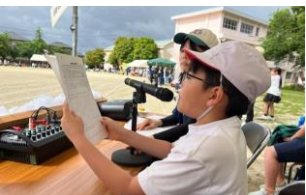
裏方での活躍：放送原稿を片手に上手にアナウンス

地域の方から心配の声が出ています。 ▼下校時、悲鳴のような大きな声を出して帰っている。 ▼下校時、横に広がっているの、交通事故が心配（最近登下校時の交通事故も続いているため） ▼国道で横断歩道のないところを自転車で横断わざと車道に倒れる行為をして遊んでいる ▼コンビニ等でのマナーや金銭の使い方が気になる ご家庭でも話題にしていきたいです。よろしくお願いします。