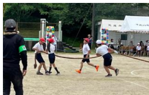
裏方での活躍：重たい綱も協力して準備しました