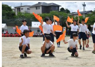
3, 4年生の旗を使ったダンス