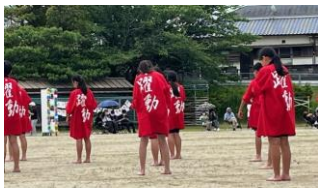
桜山伝統のよさこいソーラン