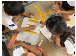
繰り下がりの引き算の考え方を算数ブロックを使って話し合う（2年生算数）