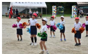
1, 2年生が可愛く踊りました