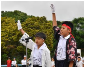
赤白両団長による誓いの言葉

また、競技や演技に取り組む姿だけでなく、4年生以上の係の子供たちは、裏方としても支えてくれていました、思いやりゾーン（今年導入）でのマナー遵守、終了後の片づけに多くのお手伝いをしていただいた保護者の方の支えもあり、心温まる運動会になったことに感謝します。