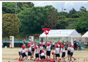
1, 2年生のチェッコリ玉入れ