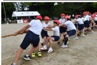
5, 6年生の力強い綱引き