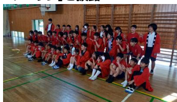
交流会の最後は、オール桜山で記念撮影