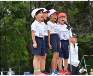
1年生による開会宣言