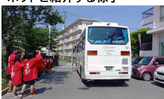
出発するバスを正門でお見送りをする6年生たち