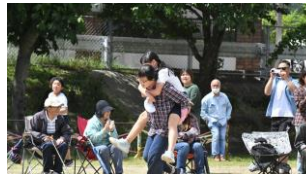
6年親子競技では、ほのぼのとした姿に観客も楽しめました