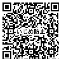
いじめ防止基本方針

★「いじめ」を含め生徒指導上犯罪の疑いのある事案については警察や児童相談所等の関係機関と連携を図ることとしています。(ネット上のトラブルは個人情報のため、学校では対応できません。この場合、警察に依頼することをご承知ください。)