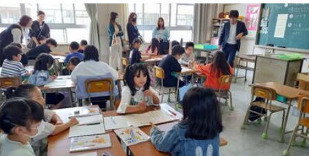
算数の学習を3人組で学び合う（3年生）

19日の授業参観及び学級懇談会は、土曜日の休みの中、多数のご参加ありがとうございました。子供たちも、ご家族から見られていることから、緊張しつつも喜んでいました。 また、24日からの家庭訪問も短い時間とは言え、ご自宅の確認と顔合わせのため都合をつけていただきありがとうございます。更に話が必要な場合は、6月の教育相談をご利用ください。