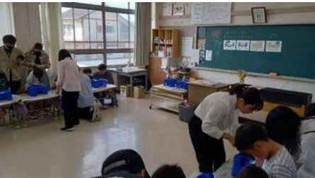
初めての授業参観「あさがおの種植え」（1年生）