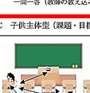
一問一答(教師の教え込み)