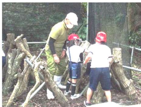
【坂瀬川の自然を大切にされた農業を学ぶ】