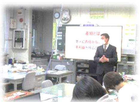
【様々な人権課題を考える職員の研修】