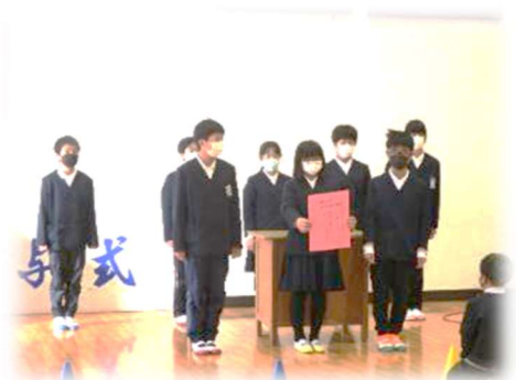
【学年の人権宣言の振り返り】