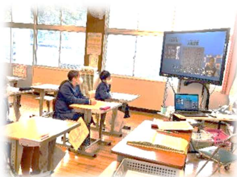
【熊本県人権子ども集会の映像視聴】

校内の人権に関わる取組をさらに充実させていくために、職員も様々な人権課題について学び合う研修を行っています。講師の先生からお話いただき、新たな視点から日々の教育実践を振り返る場となりました。