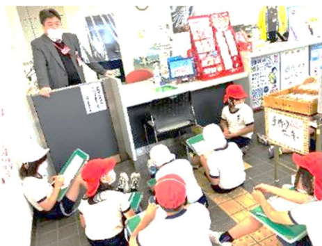
【坂瀬川郵便局のすてきな取組を学ぶ】

幼少の頃に目にしたふるさとの姿というものは、大人になっても忘れないものですし、郷土を愛する心を育むうえで、大切な教育活動であると考えています。今後も、子供たちの学習にご協力いただければ幸いです。