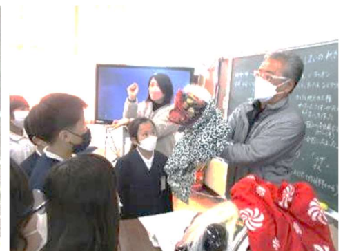
【坂瀬川の伝統 獅子舞について学ぶ】