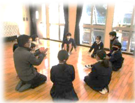
【縦割り班の友達を知るさいころトーク】