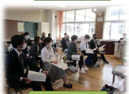
中学年 分科会の様子