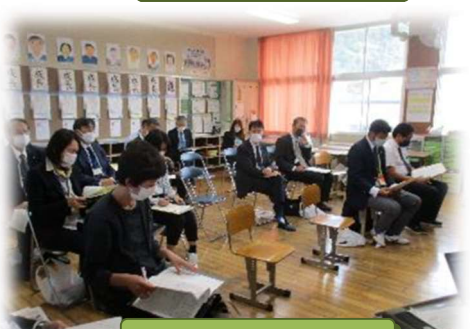
高学年 分科会の様子