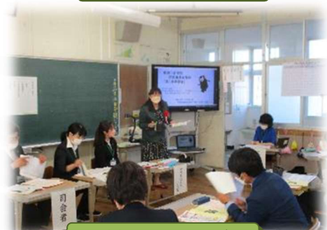
低学年 分科会の様子